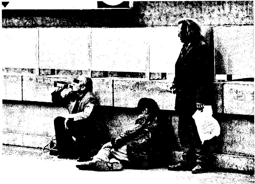
Alkoholiker: Logistisches Denken im Wahnsystem

Wer kann da helfen? Mediziner, landläufige zumindest, am wenigsten. Denn nicht nur wissen sie sowenig über Alkoholismus wie die übrige Bevölkerung auch, ihr Status als Arzt scheint sie überdies zum Bescheidwissen zu verpflichten: sie geben ihre Ohnmacht nicht zu. Also flüchten sie auf zwei Wegen: entweder sie negieren den Krankheitsfall und urteilen moralisch über haltlose Trunkenbolde, die sich